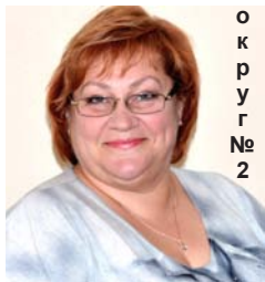
о к р у г № 2

Надеюсь, что мой жизненный опыт принесет пользу и вместе мы будем успешно решать поставленные задачи.