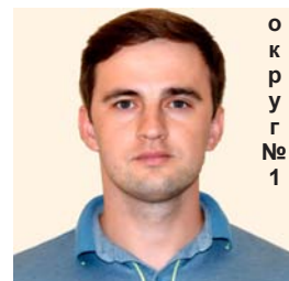
о к р у г № 1

С 2010 года является председателем Совета по развитию молодежной политики и спорта ГУП «ЛПЗ». С декабря 2013 года является членом Смоленского регионального штаба Общероссийского народного фронта. В 2014 году успешно окончил президентскую программу по подготовке управленческих кадров.